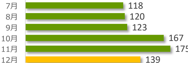
相談件数の推移（直近 6 か月）

12 月の相談件数は 139 件で、相談者の内訳は医療機関が 65 件、遺族等が 66 件、その他・不明が 8 件でした。 遺族等の求めに応じて相談内容をセンターが医療機関へ伝達したものは 0 件（累計 152 件）でした。 医療機関から医療事故の判断について相談を受け、センター合議を開催し、医療機関へ助言したものは 6 件（累計 434 件）でした。