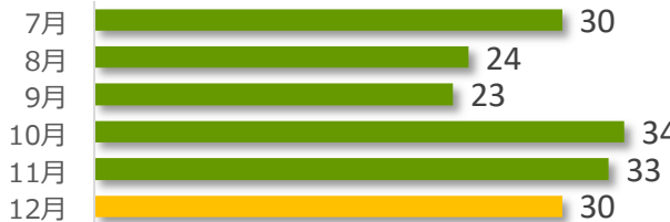
医療事故報告件数の推移（直近 6 か月）

12 月は事故発生の報告が 30 件ありました。 病院・診療所別では、病院からの報告が 29 件、診療所からの報告が 1 件でした。