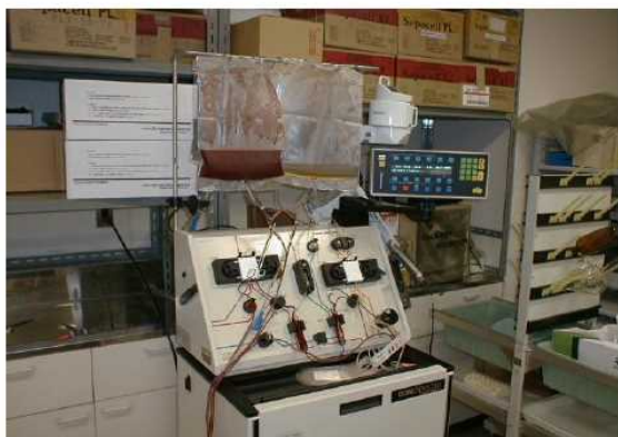
濃縮骨髄単核球細胞