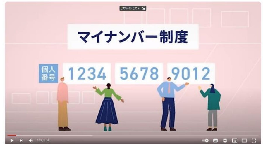
マイナンバー 制度「報告」と「対策」

マイナンバー 制度「報告」と「対策」 (youtube.com) https://www.youtube.com/watch?v=cPGselFiWxc