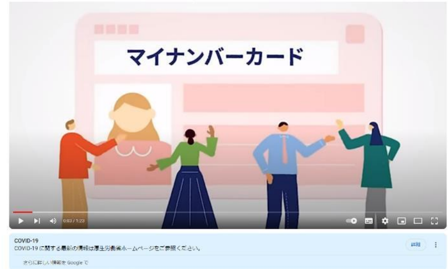
マイナンバーカード「いま」と「これから」

マイナンバーカード「いま」と「これから」 (youtube.com) https://www.youtube.com/watch?v=N2HIIPjnobY