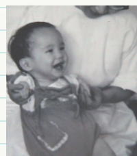
※写真は、ご本人が幼少時のものです。

ことはないと思っています。力強く生きることで苦難を乗り越えるしかないのです。このサリドマイドが、現在、再び認可され使われています。多発性骨髄腫という血液のがんやハンセン病の症状に効果があることが分かったためです。薬そのものが悪いのではない——二度と同じような被害を起こさないために、この薬の危険性をよく知って、慎重に使用してほしいと思います。