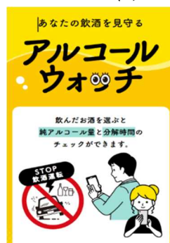
アルコールウォッチのトップ画面