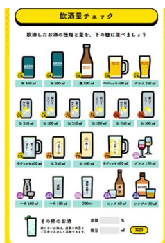
自分の飲んだお酒を選択して自動計算できる