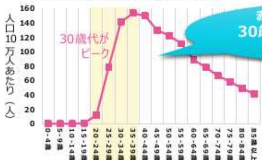
全国がん登録に基づく全国がん罹患率 (2020)