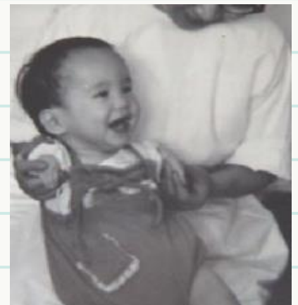
※写真は、ご本人が幼少時のものです。

ことはないと知っています。力強く生きることで苦難を乗り越えるしかないのです。このサリドマイドが、現在、再び たはせいこ 認可され使われています。多発性骨 ずいしゅ 髄腫という血液のがんやハンセン病の症状に効果があることが分かったためです。薬そのものが悪いのではない — 二度と同じような被害を起こさないために、この薬の危険性をよく知って、慎重に使用してほしいと思います。