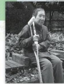
なぜ起こったのか?