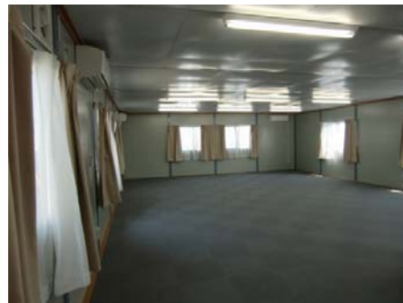
仮設住宅地内の集会室内