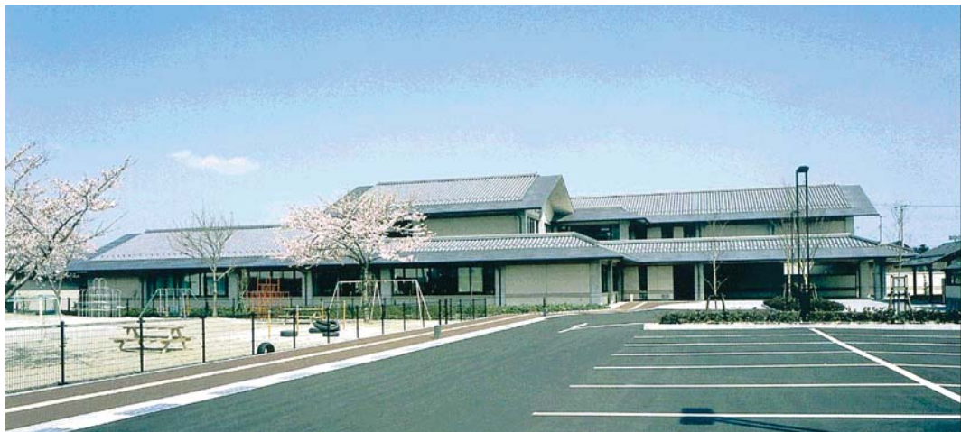
岩沼市総合福祉センター（里の杜サポートセンターが設置された施設）全景