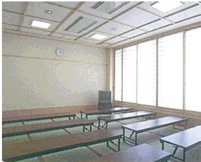
総合福祉センター内の和室