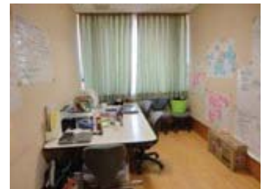
写真（上）相談窓口正面 （下）事務室内