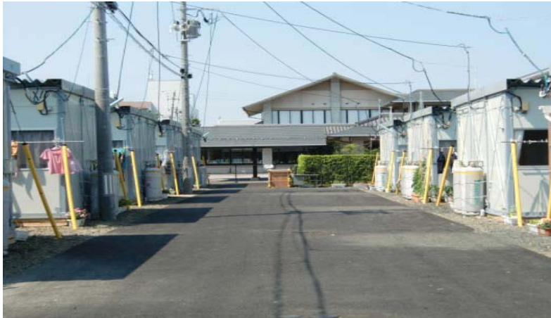
中央奥の建物が岩沼市総合福祉センター。手前に並ぶのが里の杜地区仮設住宅