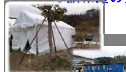
(関西広域連合事務所 3月撮影)